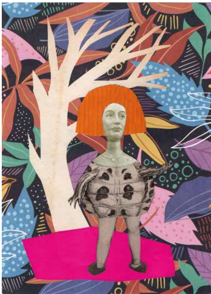
Mujer tortuga , 2020-2022